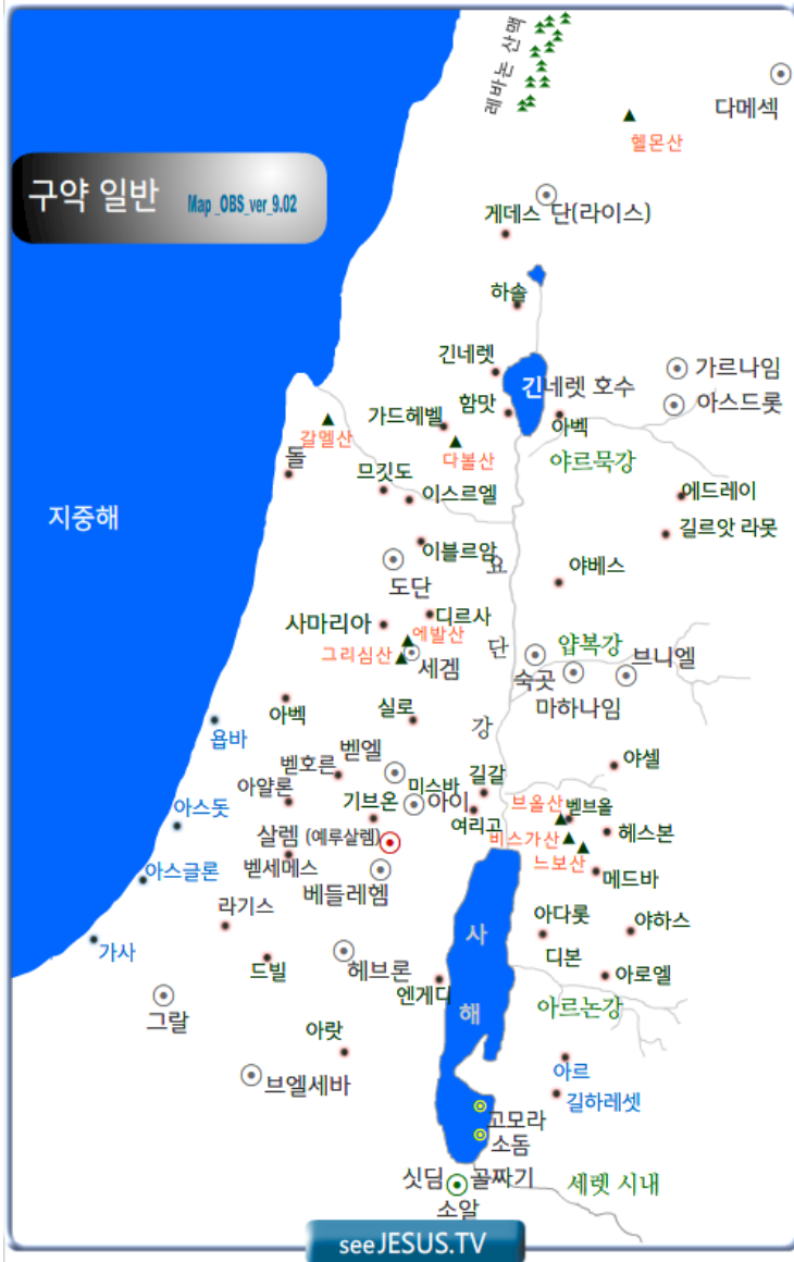
[ 구약 일반 지도 ] ver_9.02